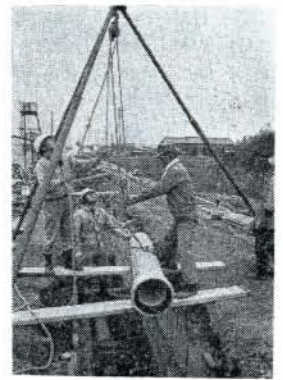
下水道管布設工事(松山郷にて)