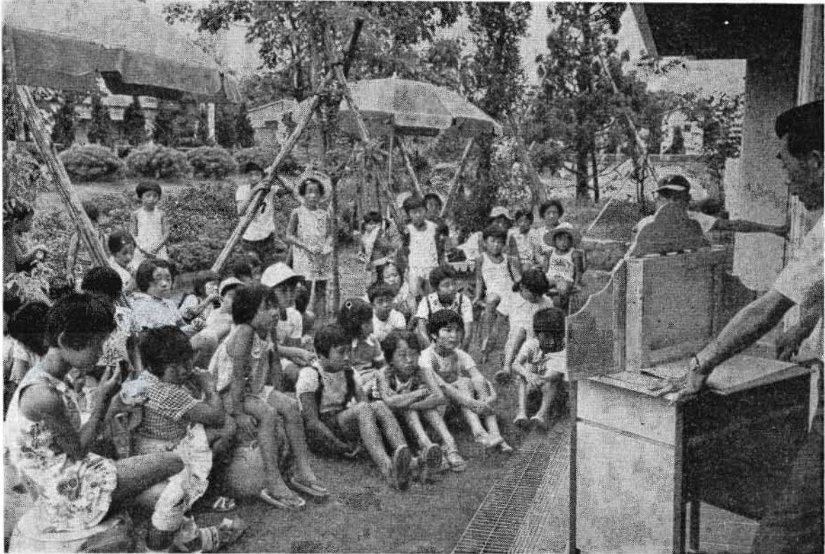
午後のひとときを木陰で紙芝居をみて楽しむ子供たち