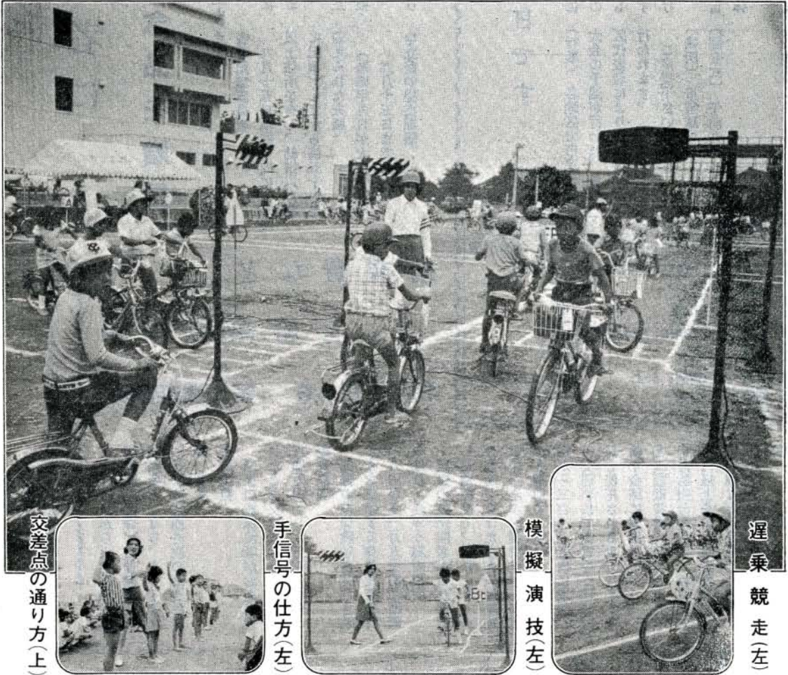
交差点の通り方(上)