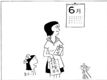
6月分 国民年金の保険料は納めましょう

四、五、六月分の国民年金の保険料は、もう納めましたか。まだ納めていない方は早目に納めましょう。保険料を納め忘れると、万一、事故があったとき障害年金や母子年金などが受けられないばかりか、将来、老齢年金さえ受けられないことがあります。もし、過去の保険料