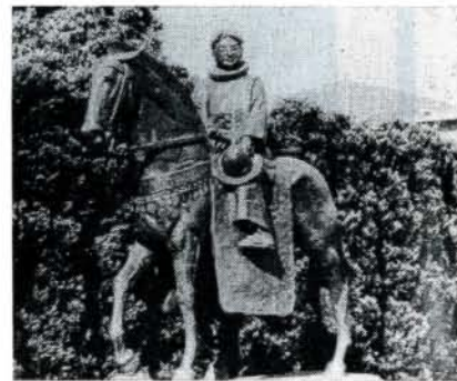
伊東マンシヨ銅像(大分市)

ス会総長に宛てた手紙の中で、イエズス会入会の決意を次のように記しています。 「自分たちが在俗のまま教会に奉仕していたのでは、