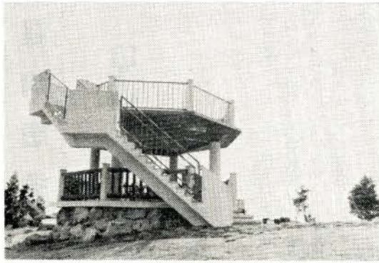
市街地、大村湾を一望されるユニークな展望台