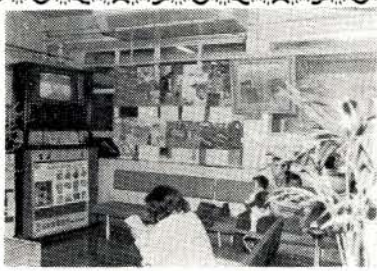
廊下に飾られた絵