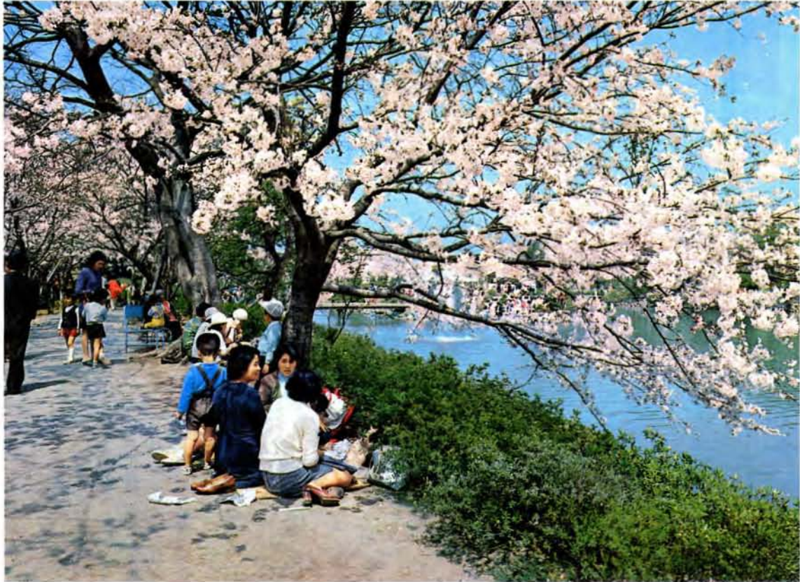
沢山の観光客でにぎわう大村公園