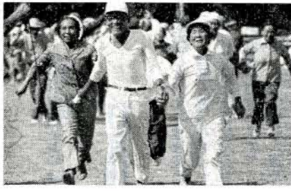
仲よく手をつないで