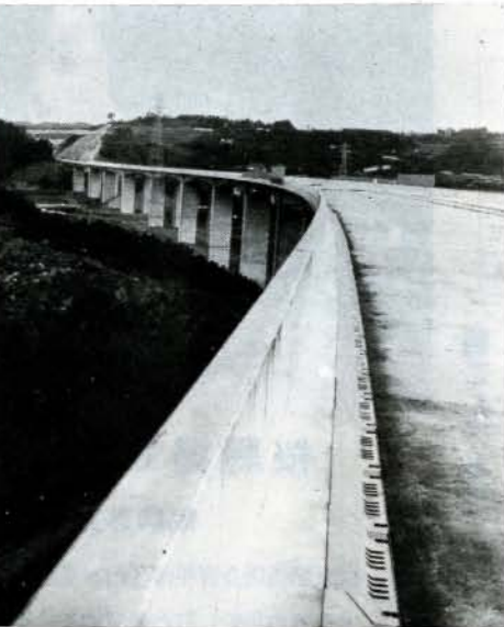
開通をまつ九州横断自動車道「鈴田橋」

る次第でございます。 県政は今日、困難な多くの課題を抱え、引き続き重要な時期を迎えております。行財政改革は、国・県を通ずる社会的要請であり、地方行政環境は一段と厳しくなってくるものと思われ