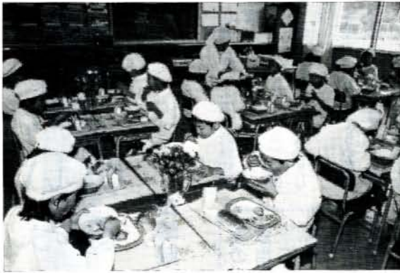
萱瀬小学校の子どもたち