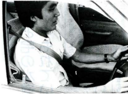
シートベルトを着用しよう

〔自転車利用者は〕 ▽安全点検・整備を確実に、自転車安全整備店などを利用しましょう。