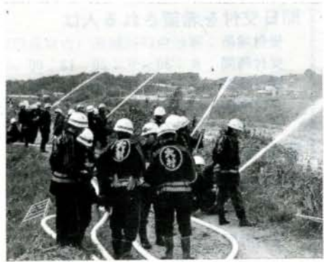
(11月26日、鬼橋付近での訓練風景)

師走―乾燥した強い風が吹く季節になり、石油ストーブなど火気を使用する機会が多くなります。