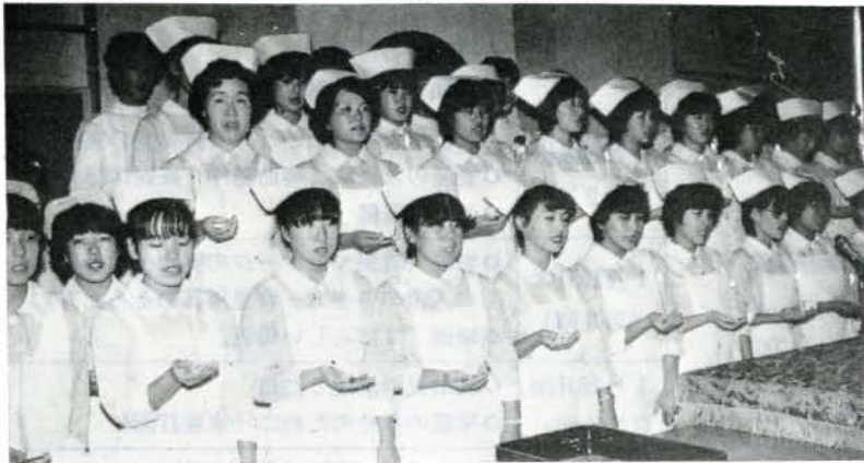
ナイチンゲールの心をこの灯に (12/3 大村看護高等専修学校) 第13回生の戴帽式が厳粛な中で行われ、一人ひとりローソクに灯をともし決意を新たにしています。 今年は45人の中に男性が10人も含まれていました。これから、頑張って、りっぱな看護婦(士)さんになって下さい。