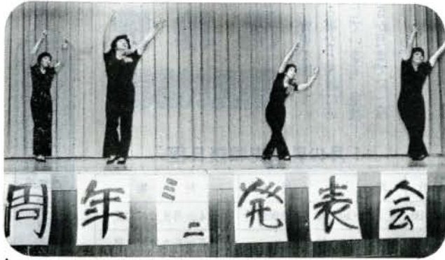
明るい家庭は主婦の健康から (11/25 コミュニティセンター)

市内の主婦でつくっている健康クラブ「木よう会」が、10周年を記念して三二発表会を行いました。30歳から60歳を超える主婦43人が「健やかな心を持つ」ことを目標に地道な活動を続けています。