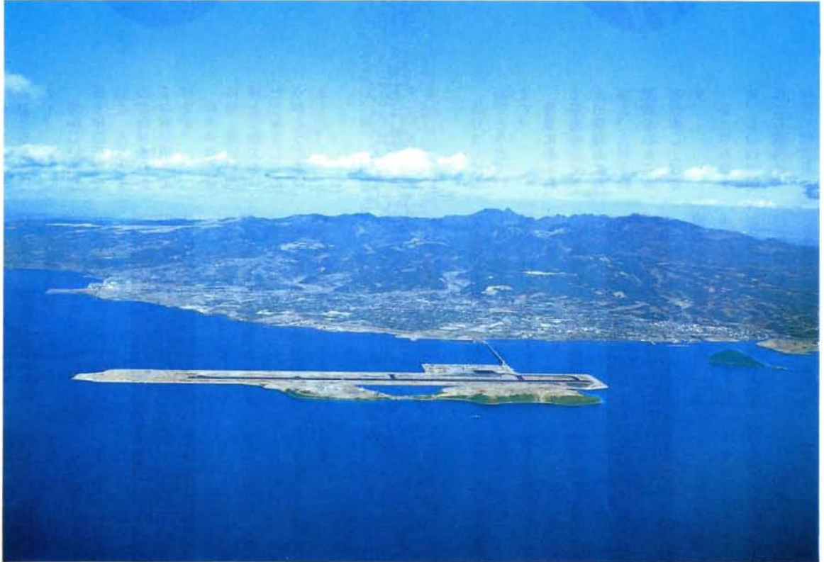
わが国初の海上空港の完成でさらに飛躍が期待される大村市の全景