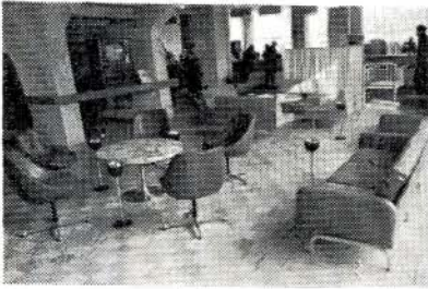
新しくできた市民コーナー

市役所の別館完成とともに本館の市民課前に市民コーナーができました。これは市民の待合室として利用していただくもので