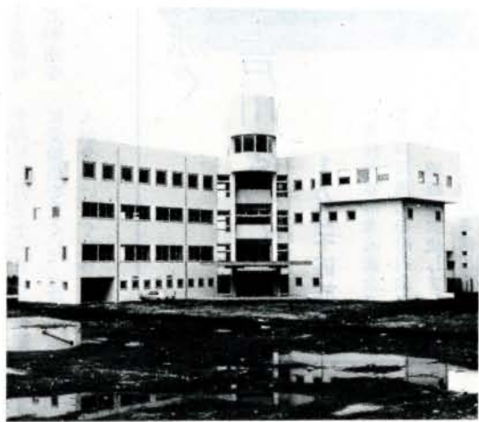
完成まじかの浄水管理センター管理棟

人口が増え、工場や住宅が多くなると一番の問題は家庭からの汚水や工場排水の処理です。皆さんの家の近くでも、家庭や工場から出される汚水で川は汚れていませんか？