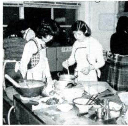
勤労青少年ホーム教養講座内容

の受講生を募集します。 楽しい魅力的なホーム講座です。ふるって参加しましょう。 対象 市内に居住または勤務