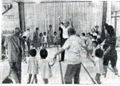
輪になって楽しくおどる 園児とお年寄