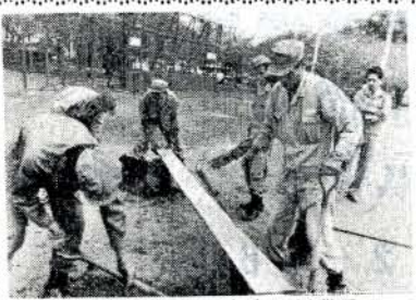
従業員の作業をするベンチのすえ付