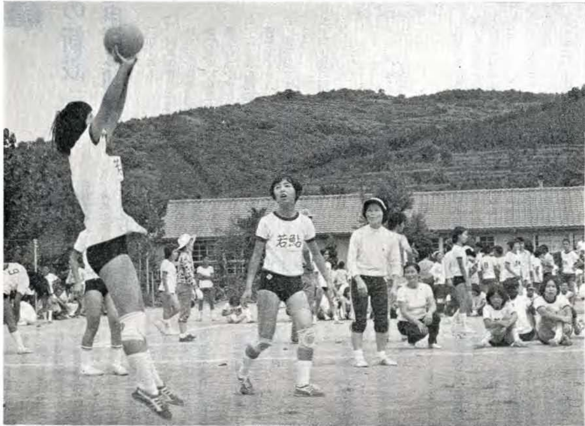
熱戦がくりひろげられた萱瀬地区 親子バレーボール大会