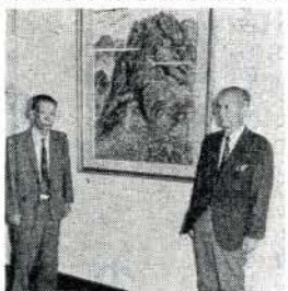
寄贈された南画と

健康に関する相談は市役所健康相談室へ(詳しくは、毎月十五日号の市政だよりをご覧ください)