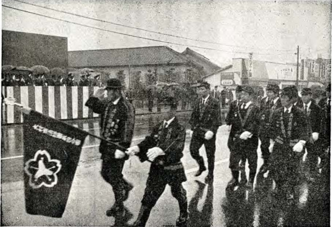
小雨降る中を整然と分列行進する消防団員