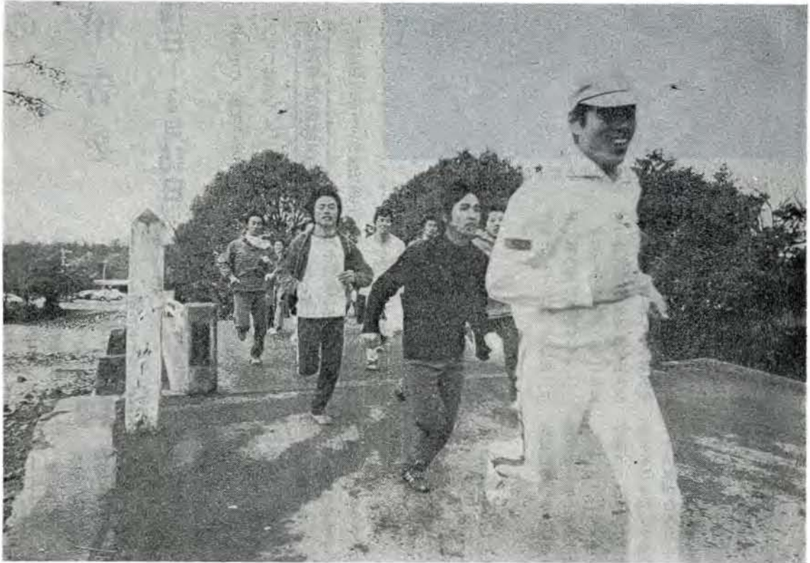
寒さを忘れて健脚を競う青年団の皆さん