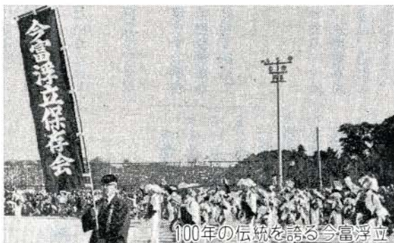
100年の伝統を誇る今富浮立