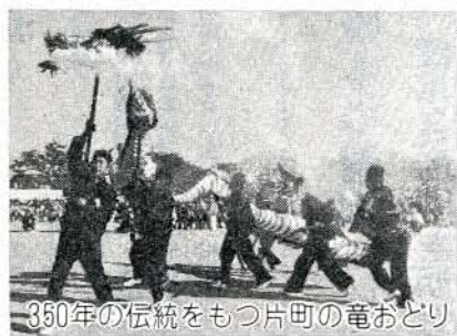
350年の伝統をもつ片町の竜おどり