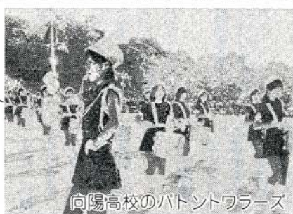
向陽高校のハットントワース