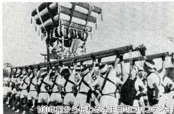
100年前から伝わる水主町のコココデンジョ