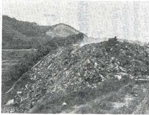
釜川内不燃物埋立処分地 いっばいになった

市としても他に適当な埋立地の開発に腐心しているところですが、早急に解決は困難な状況となっています。つきましては現在の埋立地