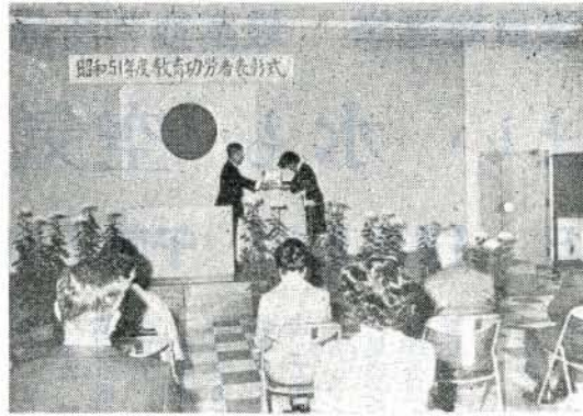
教育功労者表彰会場

十一月一日 市役所第一会議室で、本市の教育振興に寄与された方と団体、永年にわたり教育に専念された方の表彰式が行われました。当日表彰された方は次のとおりです。