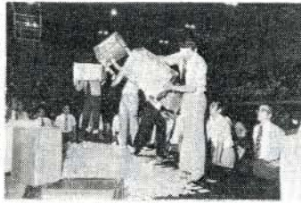
前回選挙開票風景

または産じょくにあるため歩行が著しく困難な人 ④ 市外から大村市に転入し、まだ大村市の選挙人名簿に登録されていない人、および大村市から転出予定の人