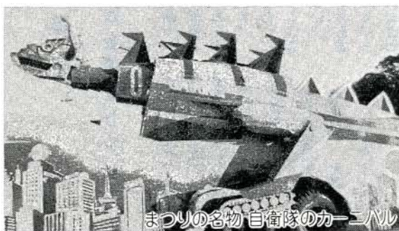
まつりの名物 自衛隊のカーニバル