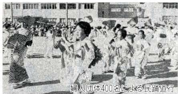
婦人団体400名による民謡道行