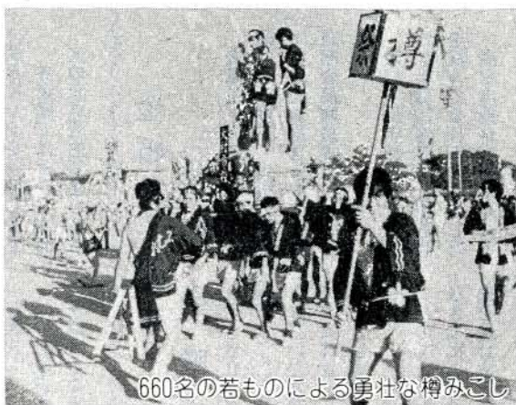
660名の若ものによる勇壮な樽みこし