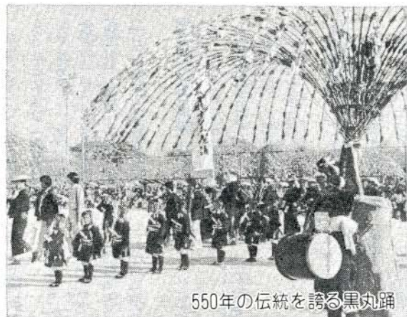
550年の伝統を誇る黒丸踊