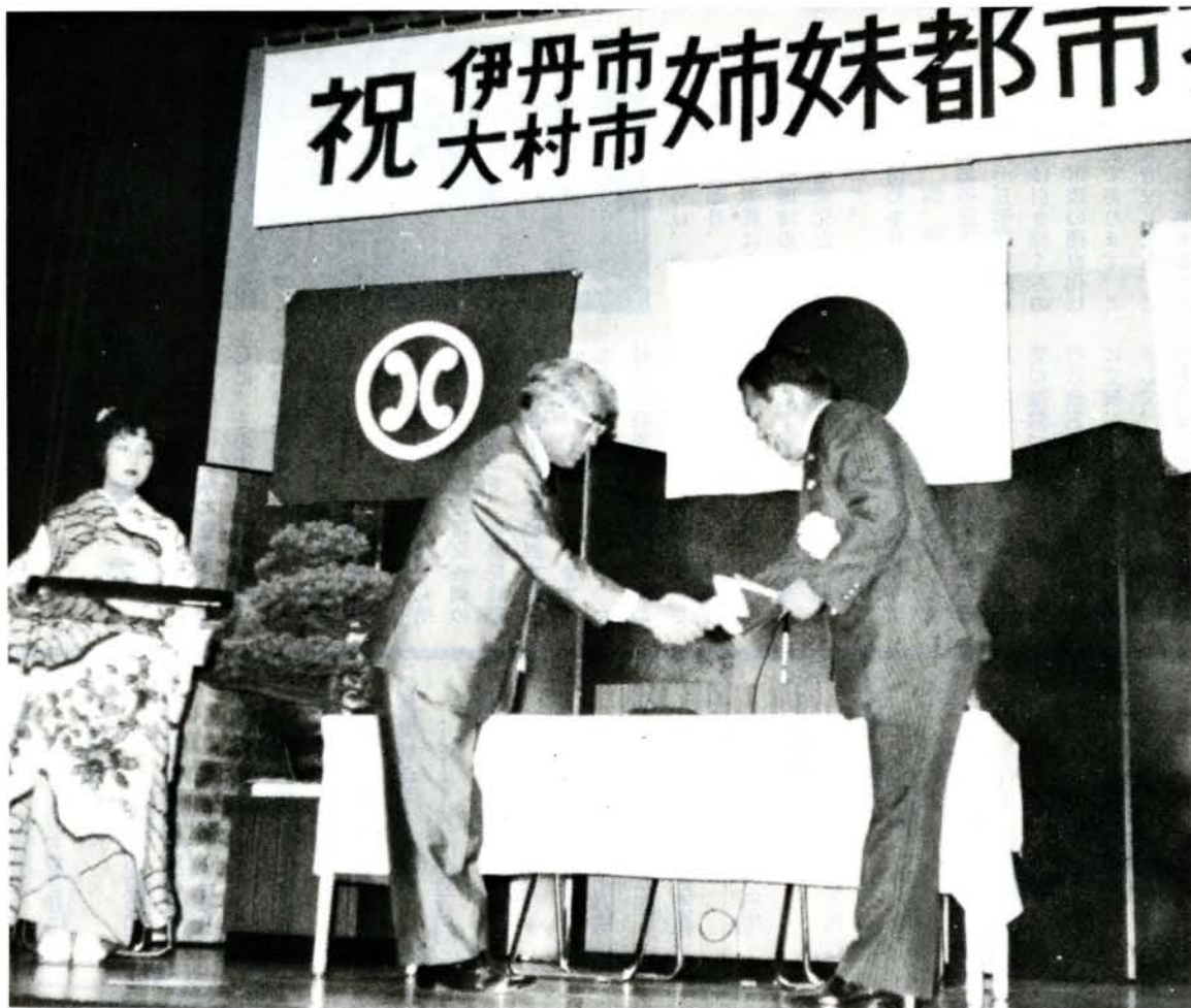
調印を終え握手する両市長