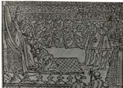
教皇に謁見する少年使節

ゲル、原マルチノ、それに多数の騎馬の貴士団というように、その列は永々と続きました。謁見はヴァチカン宮殿内の「帝王の間」で行われました。三少年が御前に進み出ると、教皇グレゴリオ十