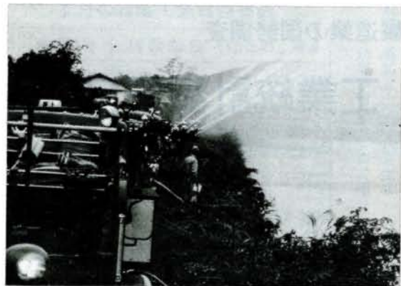
池田堤で放水訓練(11月26日)

火の元の点検を推進するため「消防の時間」を午後八時と定め、二十八日、三十一日までサイレンを吹鳴します。