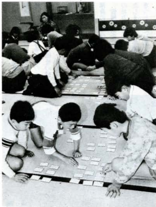
▲「田子の浦…」「ハイッ!!」(1/5 コミセン) 小学1年から高校生まで46人が集まり「新春か るた大会」を開きました。 このカルタ大会は、12月11日から1月5日まで 開いた子供かるた教室の総仕上げで子供達は真 剣な顔で、百人一首に挑戦していました。