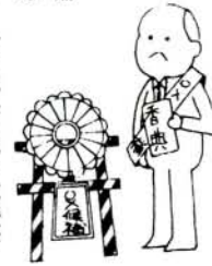
優しい人でもダメ

そこで公職選挙法では、寄付を禁止するとともに、寄付を要求することも禁止しています。候補者ばかりでなく私たち自身もこのことを自覚しなければなりません。