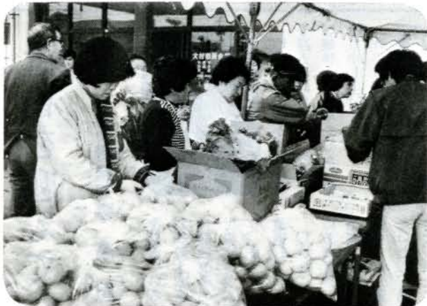
▲ 野菜を格安で即売!! (12/25 市民会館) 大村市青年農業祭が行われ、共同プロジェクト活動の実績 売表やチャリティー餅つきを行い、また、自分達の手で作 った野菜を格安で即売、またたくまに売り切れていました。

車に気をつけて、渡るんだよ (12/23 竹松小前) 交通安全県民運動を盛りあげようと、市長が一日警察署長 になって、市内の道路事情などを視察し、竹松小前では元 気よく登校する子供達に「車に気をつけて…」と声をかけ ていました。