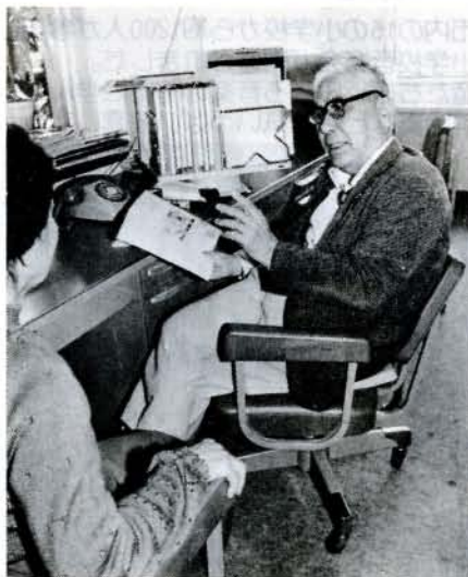
身障連事務局で、相談を受ける 身体障害者相談員。