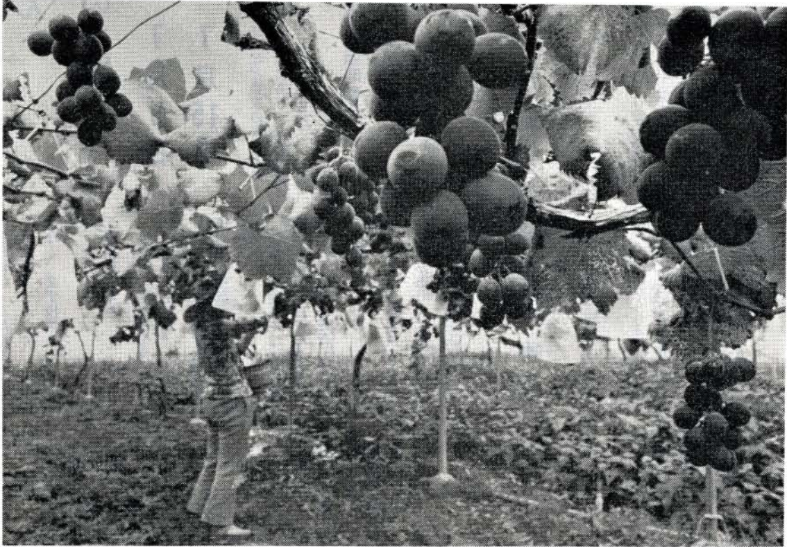
甘ずっぱい香りがたたようぶどう園