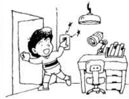
（九州電力大村営業所）

なのは、子供部屋、浴室洗面所、納戸、炊事場、トイレなど出入りの多いところです。家族みんなで気をつけて、不要なあたりは消すようにしましょう。