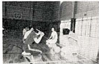
ゲーム(どちらが早い)