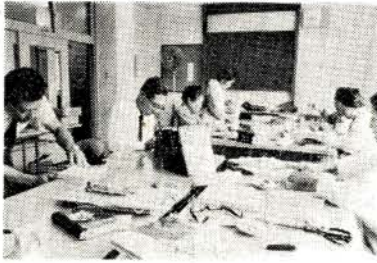
図書の修理をしているみなさん

よのもと会は昭和三十七年から始まり、現在まで二十五回の奉仕をしており、主に小・中学校のこわれた図書などを修理されるもので、一冊く奉仕活動を続けています。