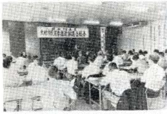
大村市民憲章推進協議会総会々場