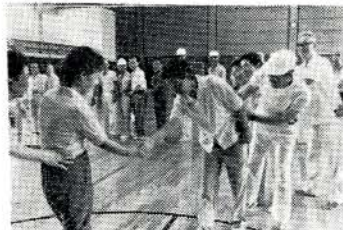
ジャンケンゲーム