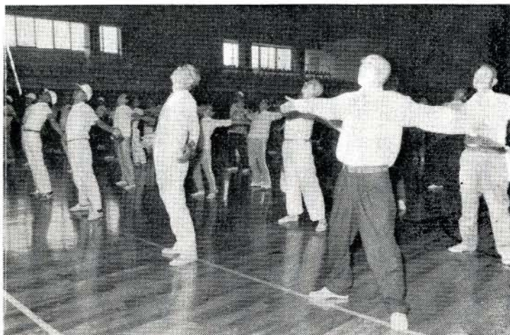
全員で長寿健康体操