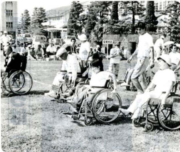
第11回大村市身体障害者スポーツ大会 (10/2 向陽高校)

初秋の日ざしの中、家族やボランティアの人たちの声援を受け、車いす競争やソフトボール投げなどにハッスルしたプレーを展開し、歓声に沸いていました。