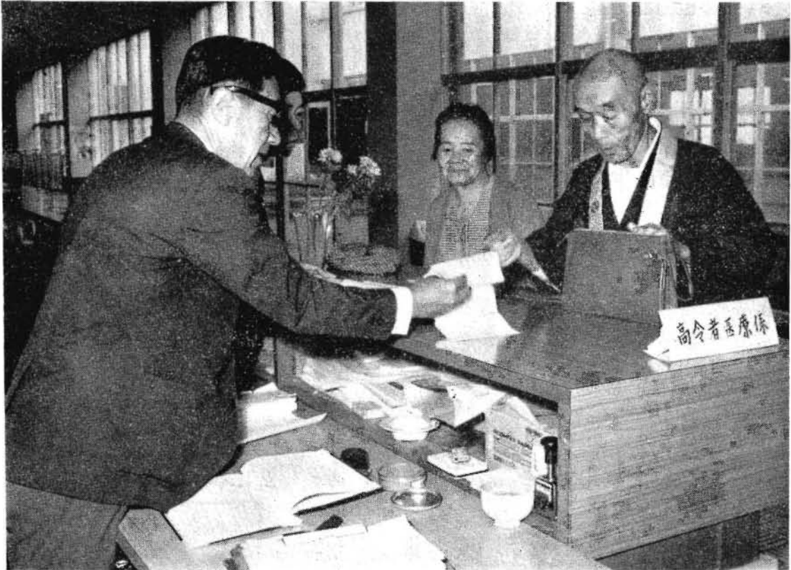
窓口で手続きをする高齢者のかたがた