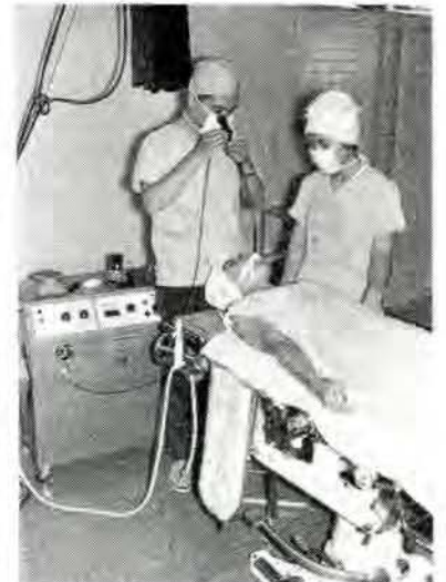
ライトガイド式気管支ファイバースコープの操作