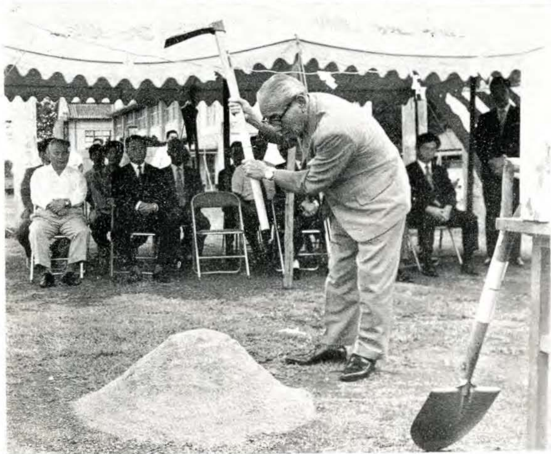
松本市長による『くわ入れの儀』