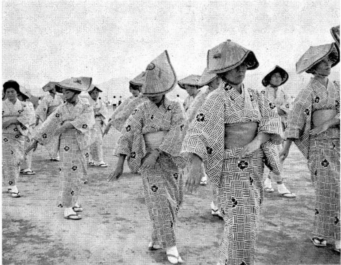
—きようもリハーサル ご苦労さま—