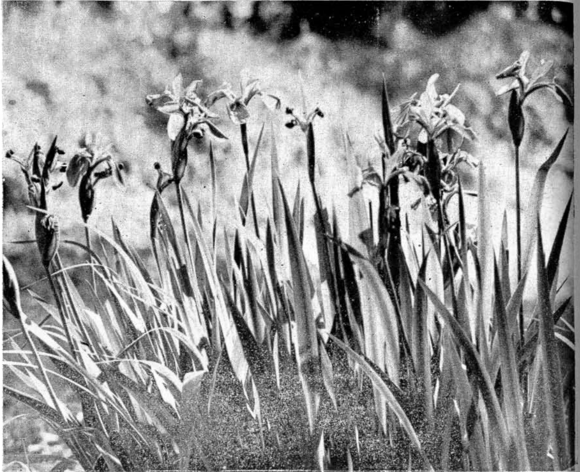
写真<大村公園にて>