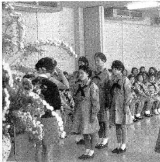
ガール・スカウト発団式 市民会館にて

昨年、国体をけい機として準備をすすめていた、ガール・スカウトが、四月二十九日、ガール・スカウト長崎県第七団の認定をうけ、市民会館で来賓、父兄、及び、佐世保、諫早、小浜の多くのスカウトたちを迎え、発団式を行ないました。少女たち一人一人が制服の胸に、リーダーから会員ピンをつけてもらい、誓い のこトバを言つて、晴れてガール・スカウトの一員となり市内の小学五年生から、中学三年生までの四十名の少女たちで結成され、毎週一回の集会を行ない将来少女が、立派な公民となれるように「やくそく」と「おきて」のもとで楽しい活動をつづけております。