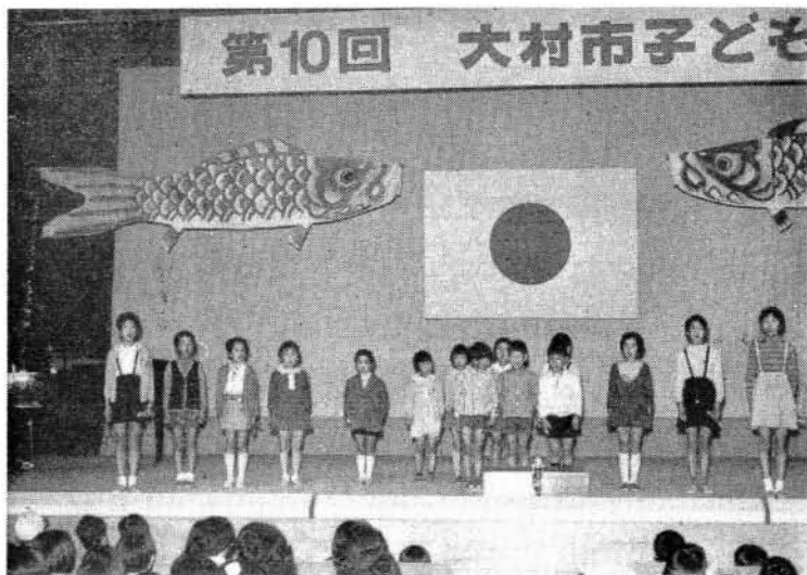
子供大会における演芸会 市民会館にて