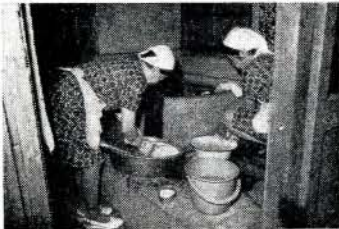
たくさんたまった汚れものの洗濯