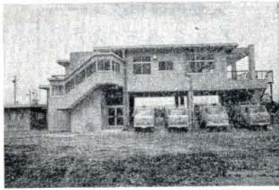
完成した汚物処理場管理棟