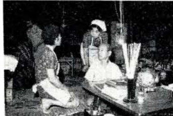
対話を通じて喜びを