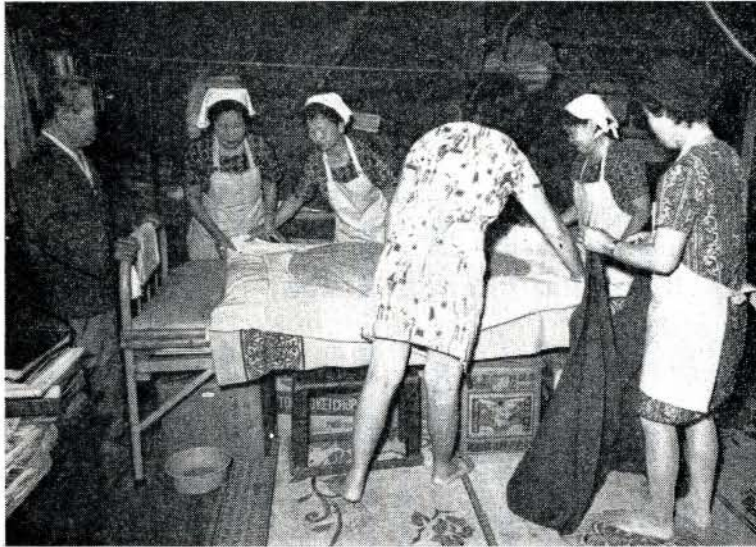
みんなで寝具の手入れ