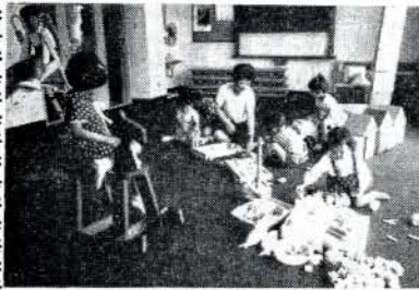
児童室で楽しく遊ぶ子供たち

梅雨明けの大掃除を七月二 十日から八月五日まで実施す るよう計画をしました。 家庭内の清掃のほか、床下 のゴミを取り除くと共に、家 の周囲の雑草の刈り取りなど 行ってください。