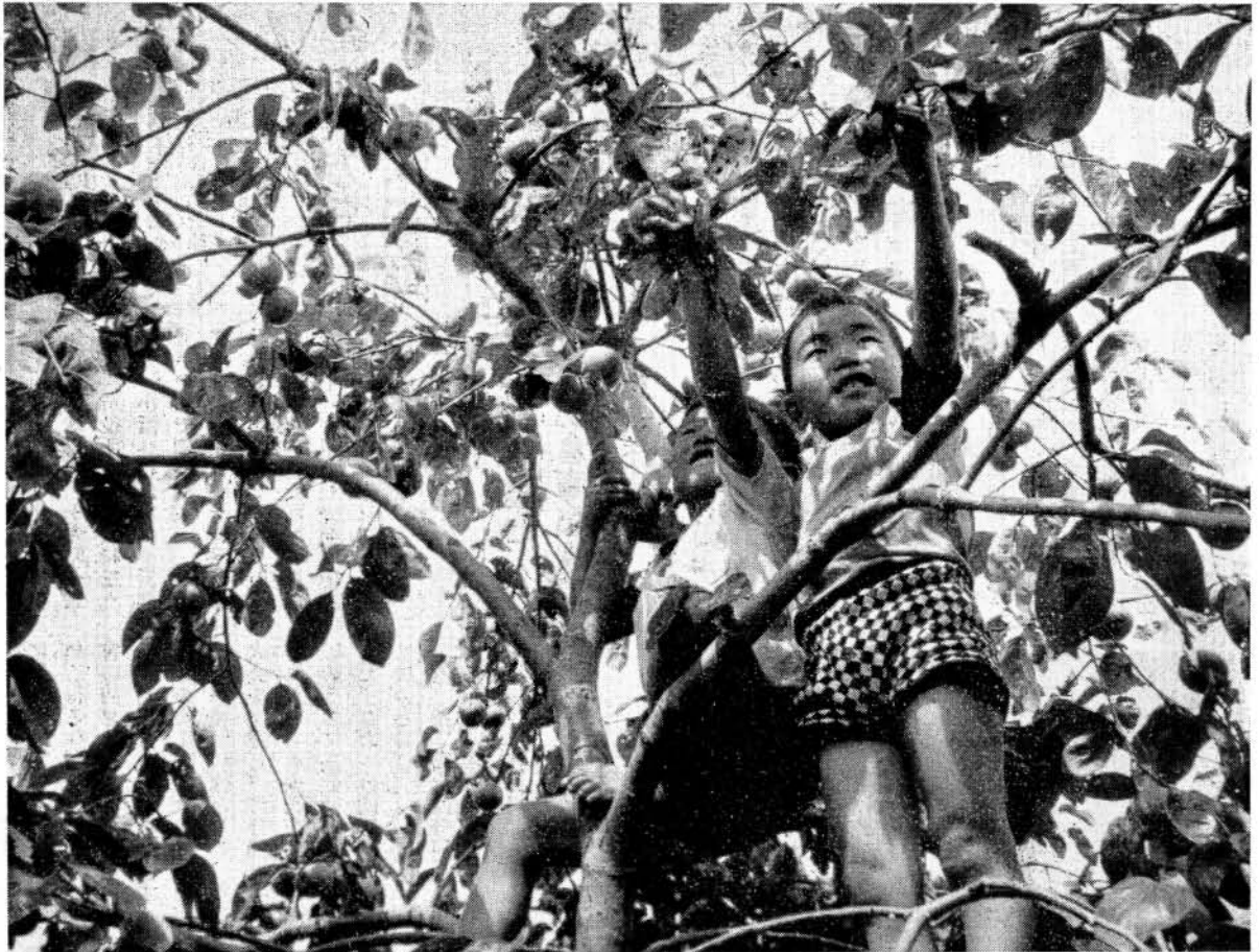
—秋の日さしに 柿の実ちぎり— (小路口住宅庭先にて)

残暑も終わつて、からだの調子もすつかりよくなり、食欲がもりもり出てくるこのごろです。