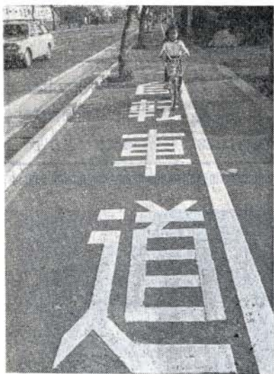
子供さんも安心して自転車乗りが出来ます

現在市内の自転車保有台数は約二万五千台で、主に通勤通学に使用されておりますが自動車量の増加にともない、自転車の事故も多く、昨年は三十二件、うち死亡事故が二件ありました。