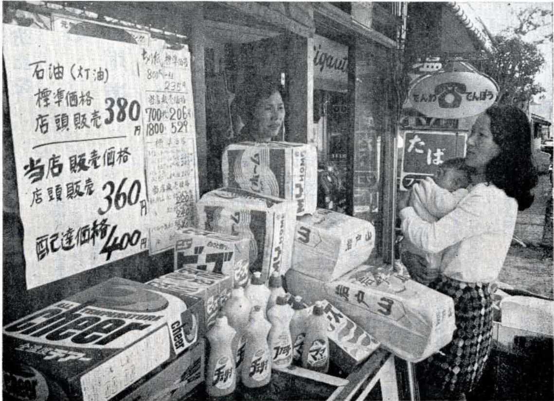
店頭に大きくはり出された標準価格と販売価格の表示