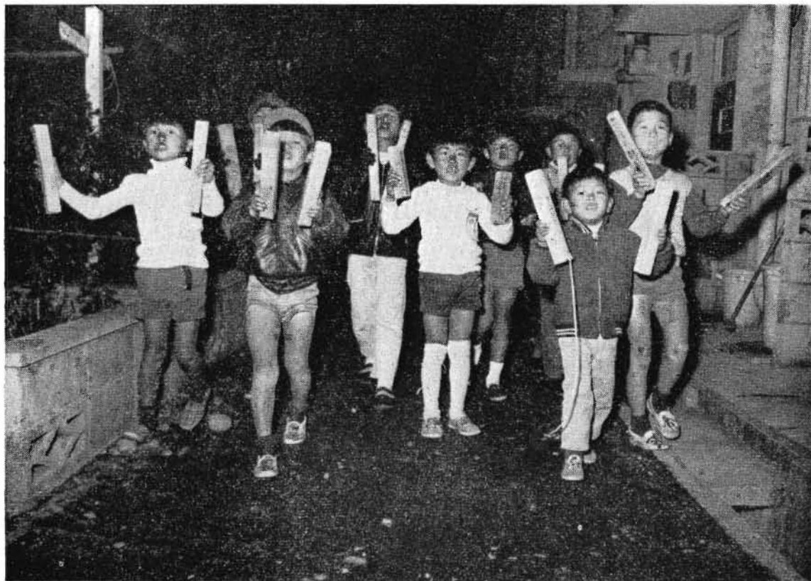
師走の夜をきょうも元気に「火の用心」を呼びかけるこどもたち