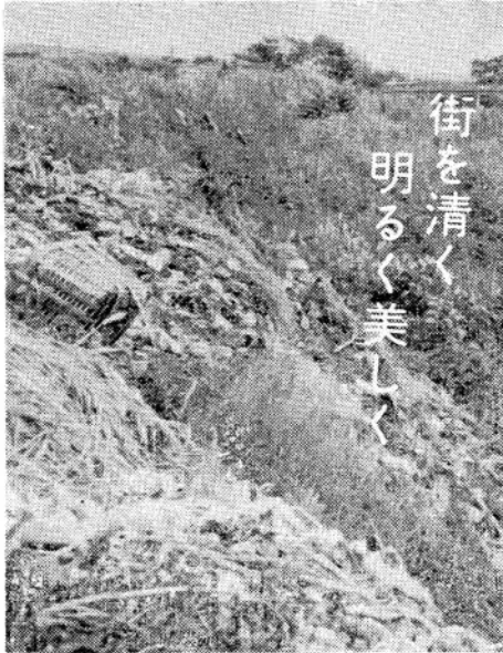
街を清く 明るく美しく

そこでわが国の歴史、文化などの理解のために欠くことのできない大切な資料を永く保存し、十分に活用するため、昭和二十五年文化財保護法が制定され、文化財を保護することを決めています。この法律には、建造物、絵画、工芸品、演劇、音楽、衣食住、年中行事、古墳、城跡などのほか動植物、植物なども貴重で価値のあるものは重要なものから文化財として指定することになっています。このように指定された文化財は、学術研究上また教育上、貴重な資料となるものですから、みじ