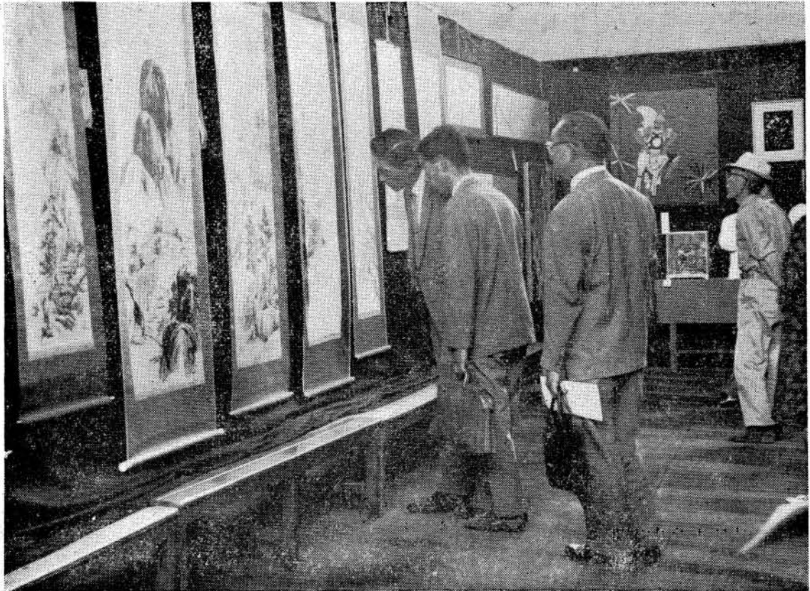
○ (1)ここをとしてください ○

■昭和33年4月22日第三種郵便物認可 ■毎月3回1日・10日・20日・発行定価1部5円 ■発行所 大村市役所 ■編集人 総務課長 南野 鹿松 ■印刷所 つじ印刷所