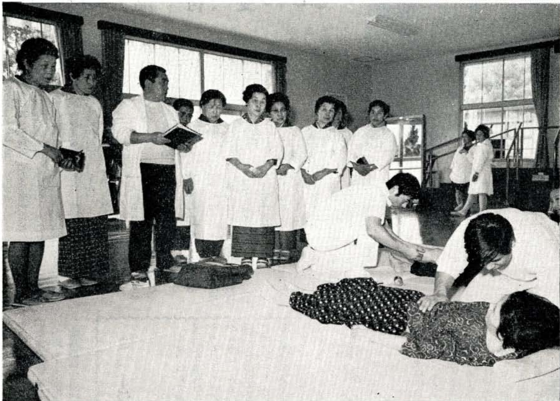
別府外科医長の説明で熱心に治療の方法を勉強する母子会のかたがた