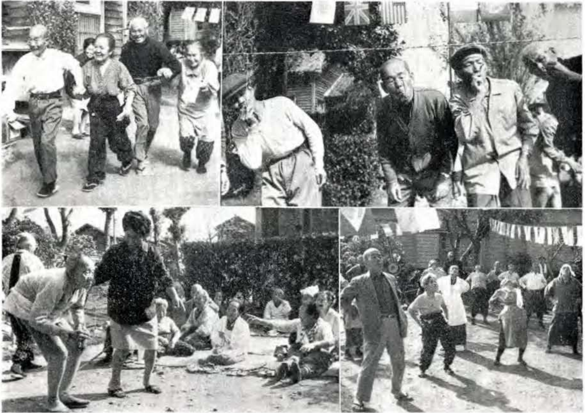
うれしいアベック競走 | なかなかつかないたばこ火つけ競走 決勝まであと一息 | 準備体操で足腰をのぼして