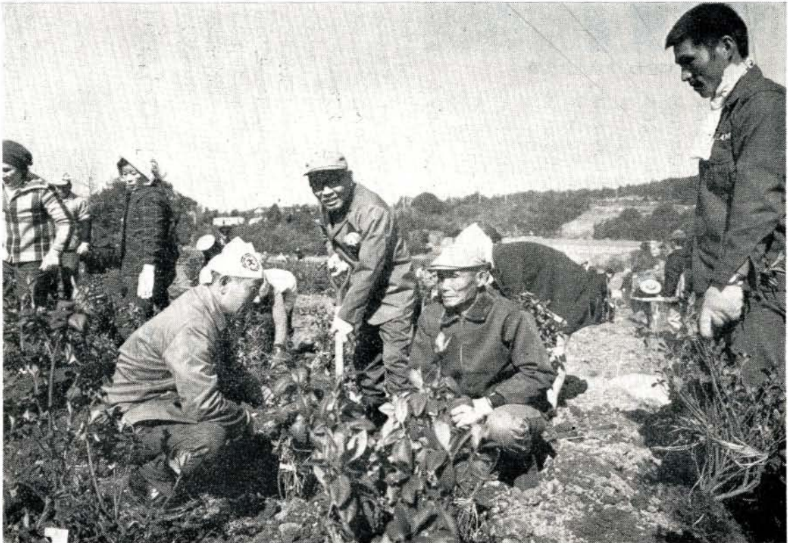
みんなといっしょに記念植樹をする松本市長（中央）