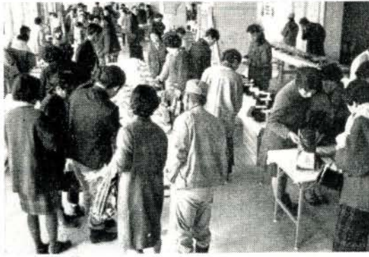
にぎわった共進会会場