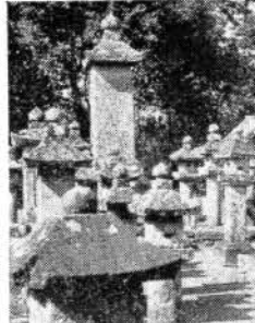
境内には、大村家の墓碑(墓石七十八基、灯籠四十八基)があります。平方メートルあります。