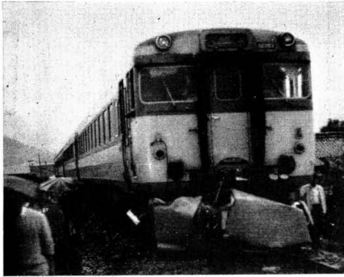
昭和44年5月27日松浦線沖田踏切にて

長崎鉄道公安室管内で、昭和四十四年度中に発生した鉄道妨害は一〇二件で、前年度より十三件減少してはいますが、内容的には警報ベルを無視しての踏切通行、レールに石を並べる等の悪質な事故が増加しています。