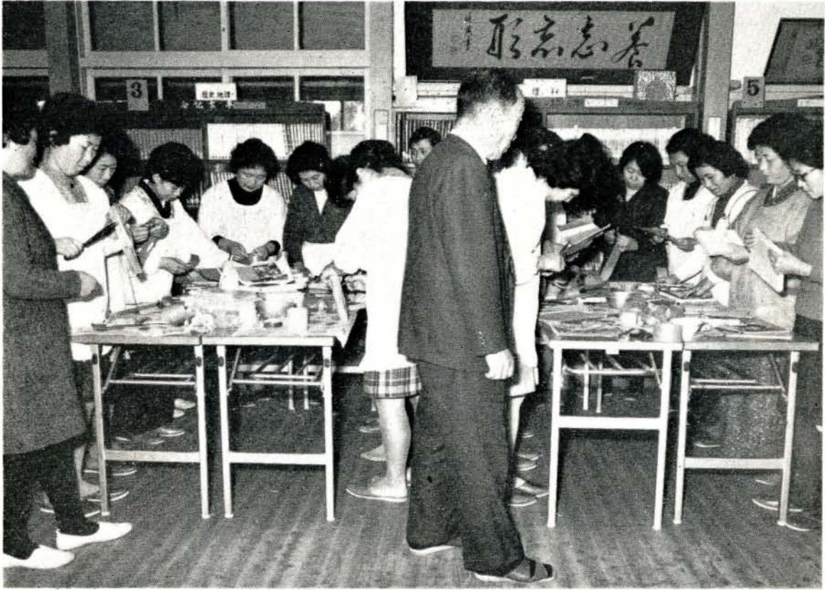
先生といっしょに補修作業にはげむおかあさんたち (大村小学校図書室)