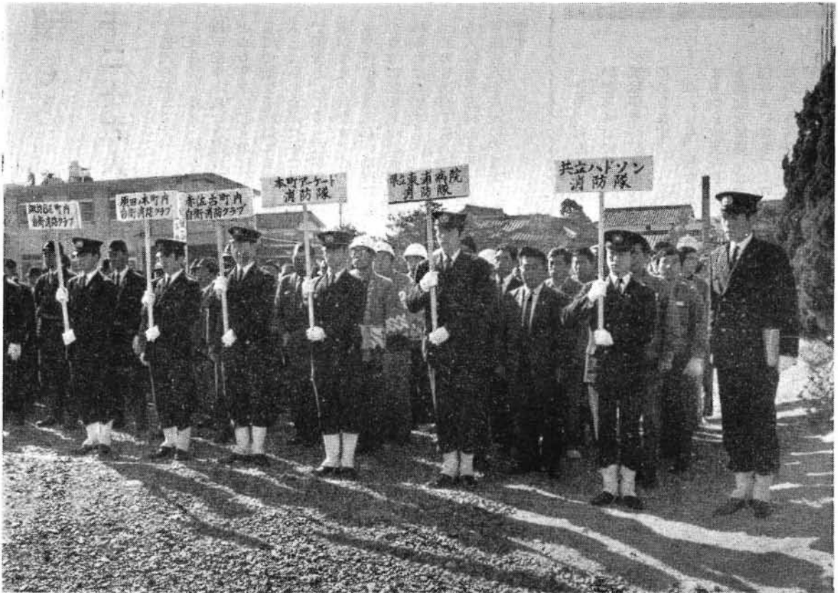
出ぞめ式に勢ぞろいした自衛消防クラブ