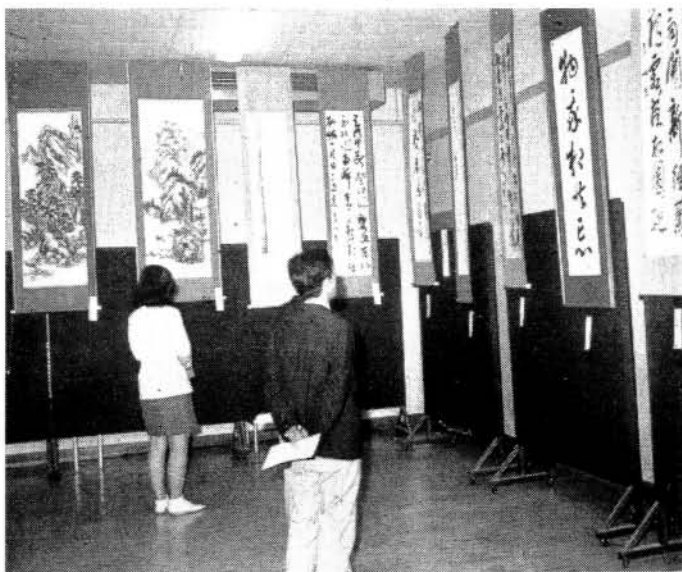
市民会館において

▲加入できる方 ○現在会社等の職場年金制度に加入していない方 ○扶助料(遺族年金・戦争公務扶助料)をもらっている方 ▲加入できない方 ○現在会社などの公的年金制度(会社、官公庁、船保など)で年金給付をうけること ▲届出に必要なもの印かん 六月三十日まで