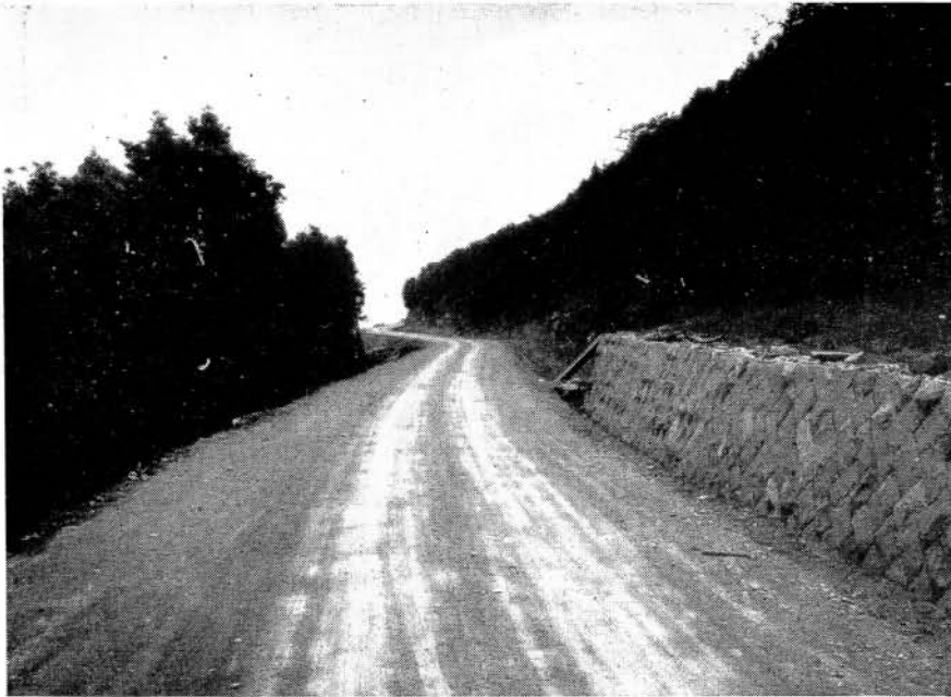
農業地域の幹線農道