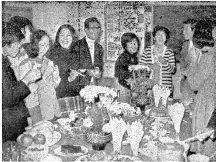
英会話グループの集い (中央公民館)

例の利用が主なものですが、特に、ここ二、三年前から、情報化社会といわれる世相を反映して、独自の研究、趣味グループが目ばえ、活発な活動をおこなっています。 利用率を四十四年と四十五