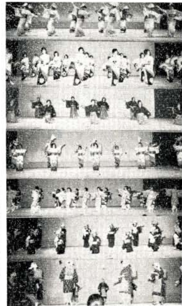
楽しかったレクリエーション