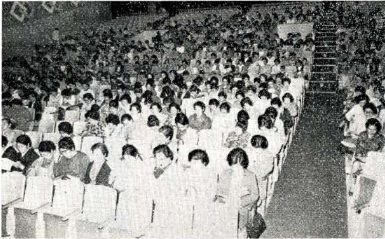
真剣に問題と取り組む婦人会のみなさん