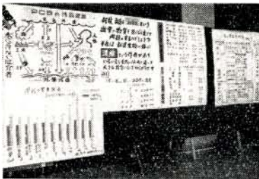
会場に展示された調査資料