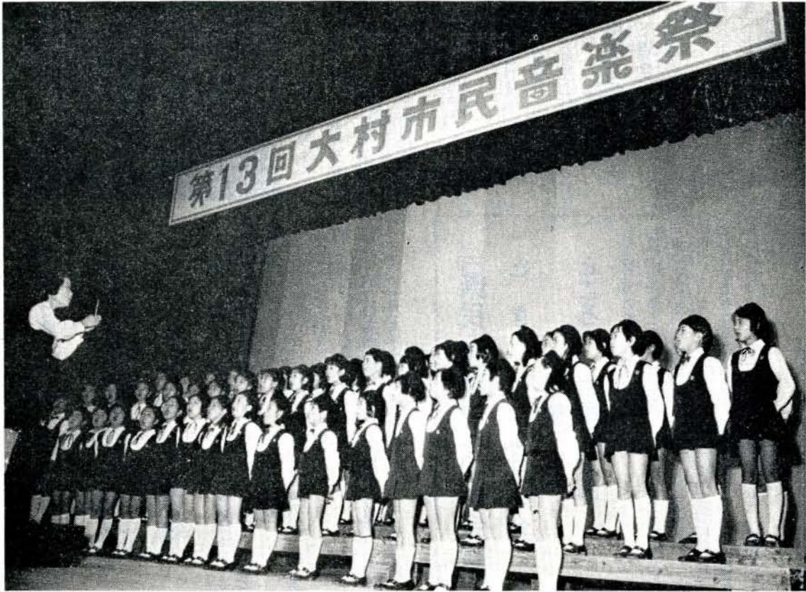
市民音楽祭で発表する少年合唱団のみなさん