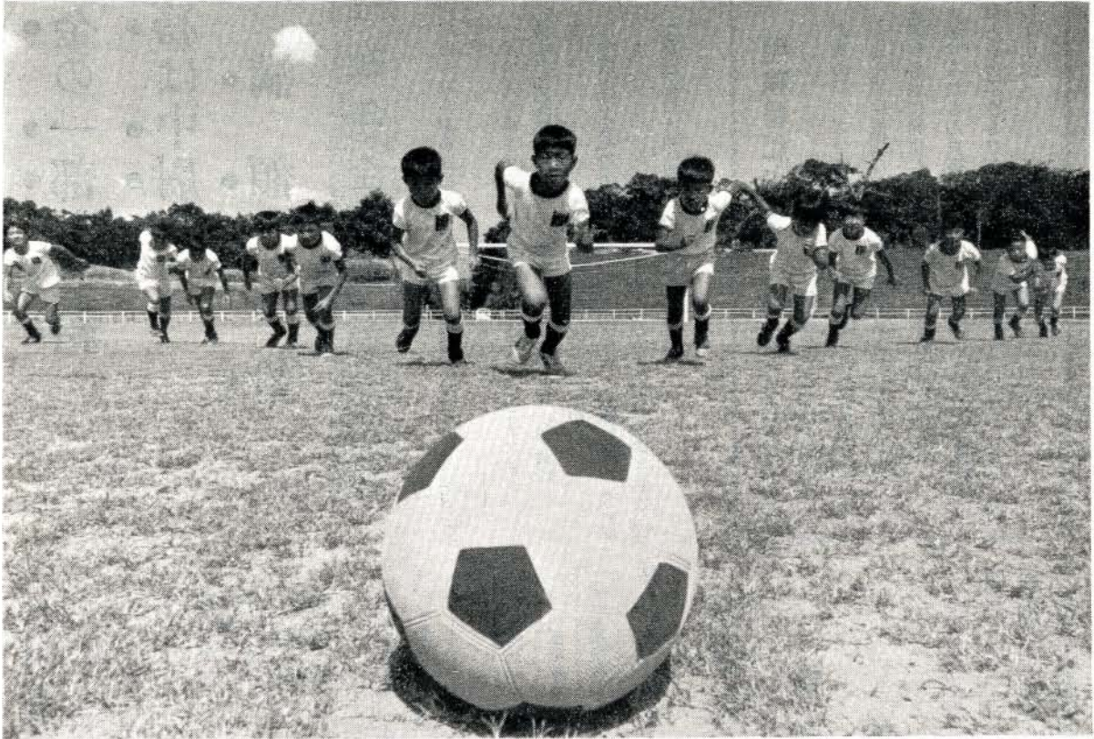
ボールを追いかけるこどもたち