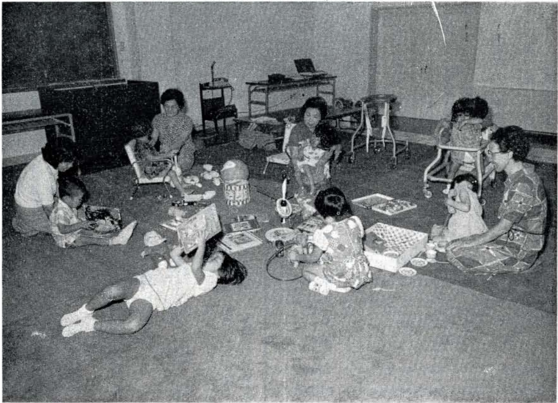
楽しく自由に遊んでいる1日保育のみなさん