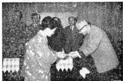
国体大村会場を成功 させるためにと寄附 大村市民踊協会は、長